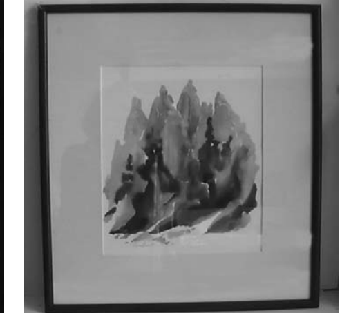
Romeo Andronic - „Psalmul 103-9“