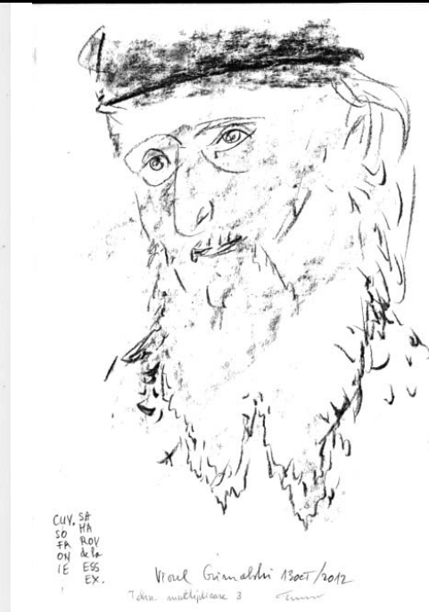
Viorel Grimalschi - „Saharov“