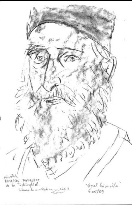
Viorel Grimalschi - „Părintele Arsenie Boca“