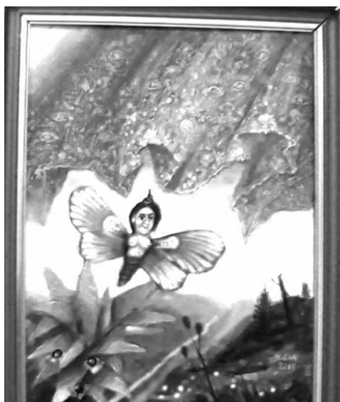
Nicolae Sava - „Indiscreție“