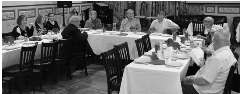
Aspect din sală