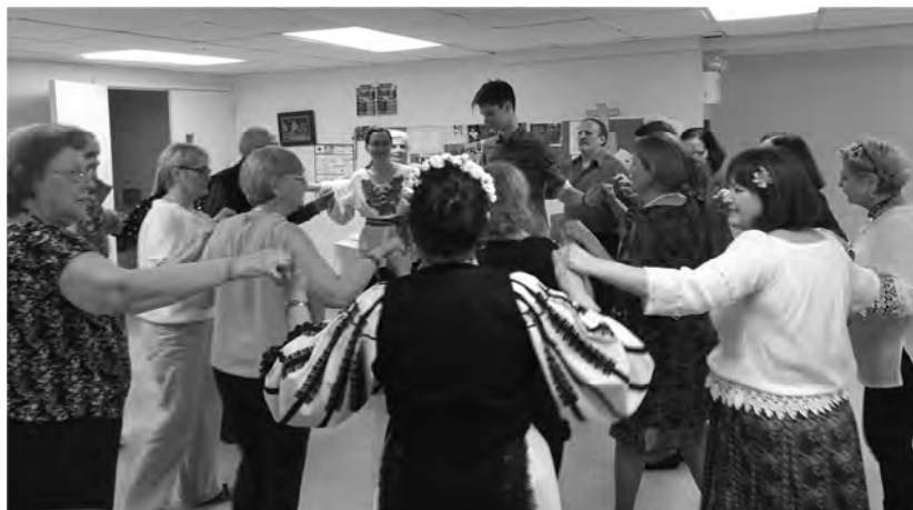
În sala socială cântec, joc și voie bună.