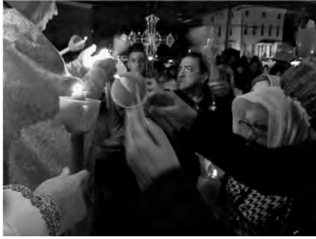
Sf. Pasti, 8 aprilie 2018, Biserica “Sf. Ap.Petru și Pavel, Astoria, New York